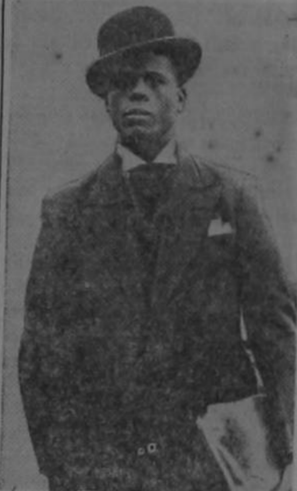
THE BLACK EAGLE Hubert Julian, called the "Black Eagle", who has gone to Abyssinia to place his services, as an Aviator, at the disposal of the Emperor, in case the threatened war materializes. (from "La Prensa Libre")