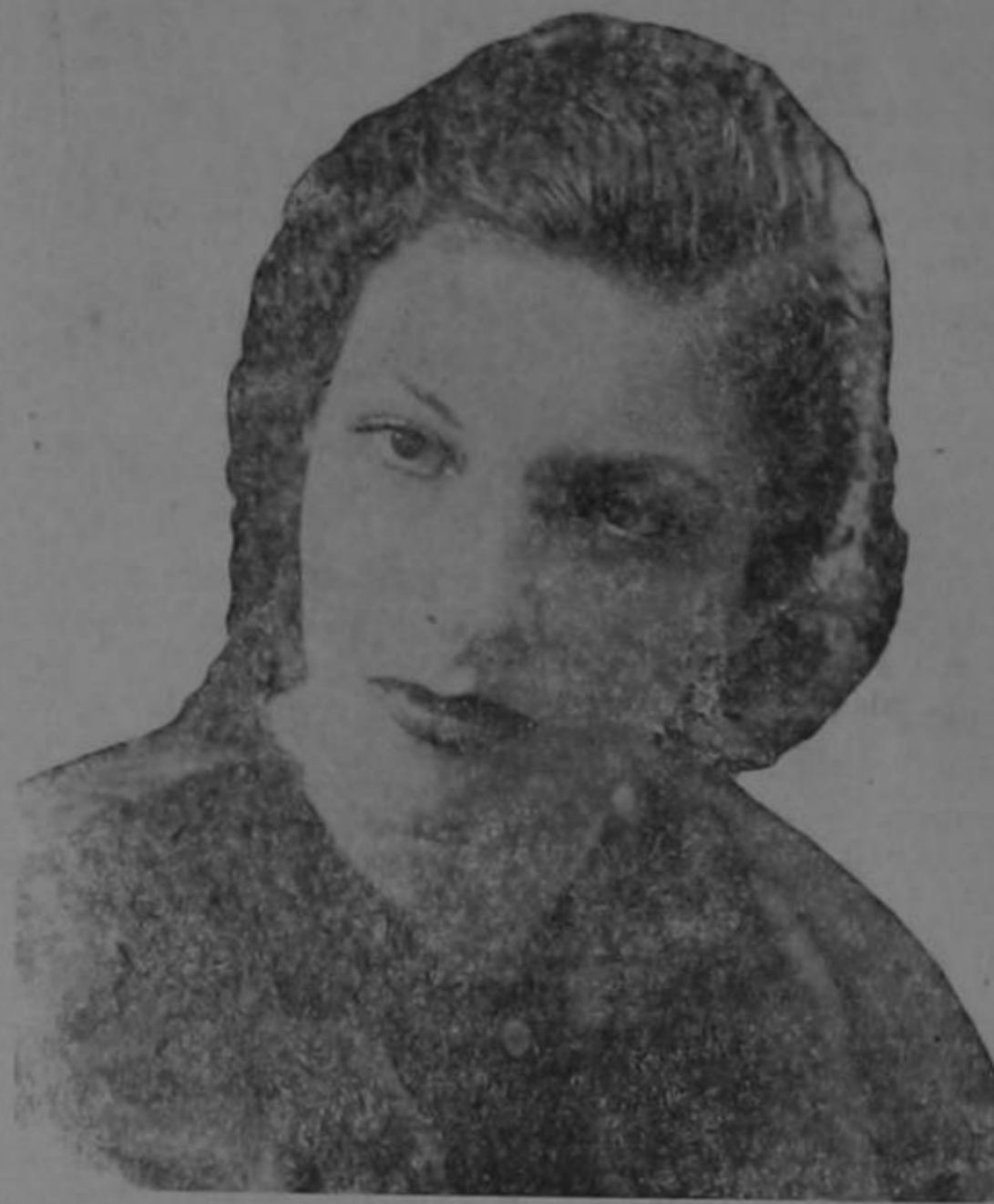
Distinguida y bella amiguita, quien nos obsequió unos pocos días de permanencia en esta ciudad.